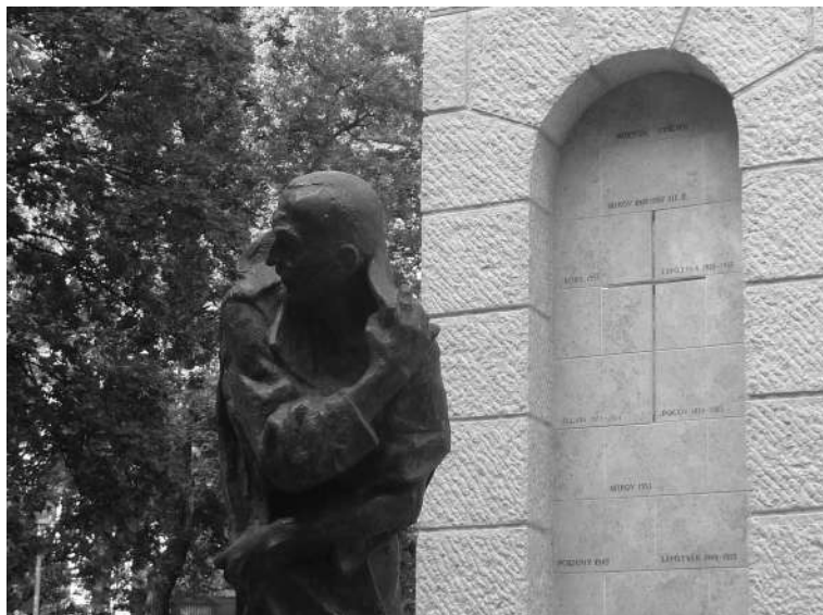
Gróf Esterházy János szobra Budapesten a Gesztenyekertben

keresztjét. Közéleti tevékenysége is értékteremtő volt: a legfontosabb ezek között a Csemadok, a szlovákiai magyarok érdekvédő szervezete, a Magyar Közösség Pártja és a Szent György Lovagrend, valamint az Esterházy János Szülőföldjéért Egyesület, melynek alapítója és elnöke volt. Az általa emelt kápolna kriptájában, Esterházy János mellett temették el 2018. június 18-án.