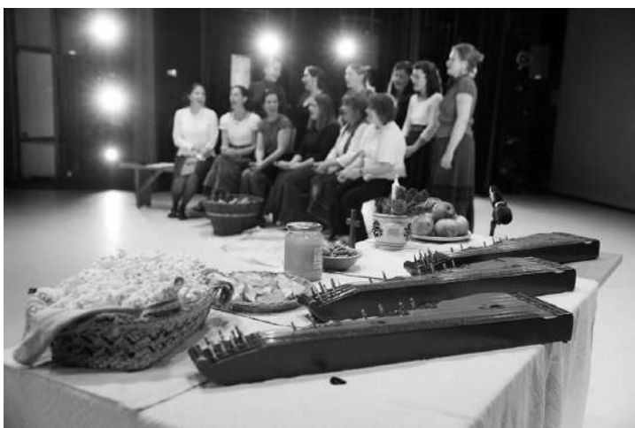
A Búzaszem Általános Iskola növendékeivel és tanáraival a Hagyományok Házában

Halmos Béla Program támogatásának köszönhetően rendszeresen találkozunk Gödön, Budapesten, Tihanyban, Keszthelyen, Tapolcán, Kiscsőszön és Dörgicsén, de tartottam dúdolókat Erdélyben, sőt a diaszpórában élő magyaroknak Prágában és Buenos Airesben is. Nagyon fontosnak tartom a rendszerességet: hétről hétre, vagy két hétről két hétre eljutni egymáshoz. A „kemény mag” már közösséget alkot és ünnepel. Kodály maga mondta, hogy az éneklést ajándékba kaptuk Istentől. Önmagunk megismerését, felvirágozását és kiteljesedését szolgálja. Terápia. Út önmagunk felé. Nagy lehetőség élni vele! Aki nem él vele, lelki vérszegénységben él és hal.