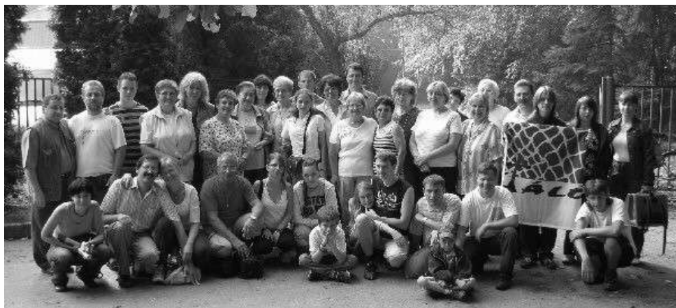
Délvidéki hálósok a 2008-as Háló-táborban Tatán