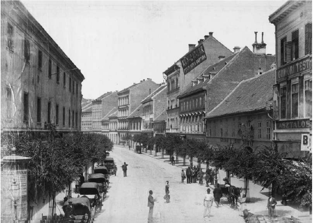
Semmelweis (Újvilág) utca a Kossuth Lajos utca felől nézve 1894-ben. Levéltári jelzet: HU.BFL.XV.19.d.1.08.014